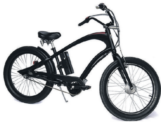
Elektra van Bikebuilders. Elektrische ombouwset €600,- (exclusief fiets) fotograaf