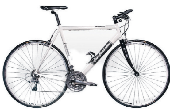
Jan Janssen Nemo road hybride. €1045,-