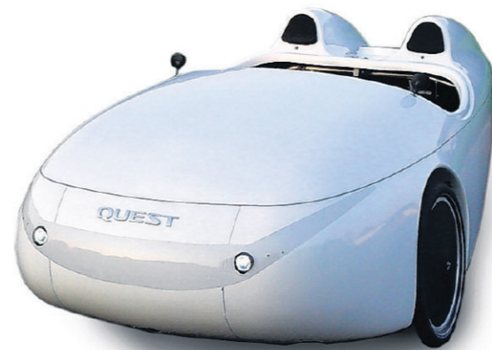
Quest duo 2-persoons. Prijs op aanvraag bij Velomobiel.