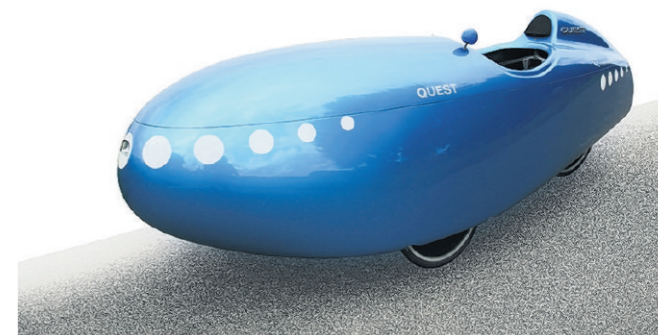
Quest ligfiets 1-persoons. €5950,-